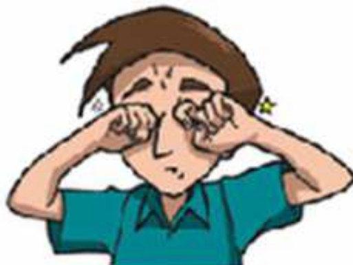
DOR NOS OLHOS