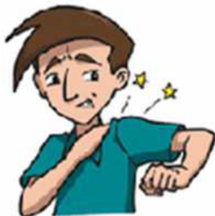
DOR NAS JUNTAS