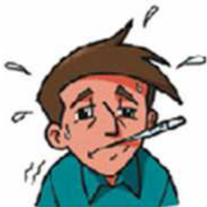
FEBRE ALTA E SÚBITA