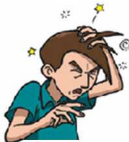
DOR DE CABEÇA