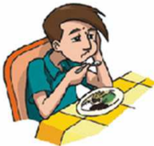
FALTA DE APETITE