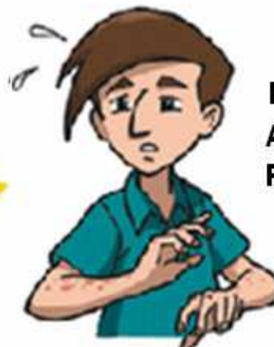
MANCHAS AVERMELHADAS PELO CORPO